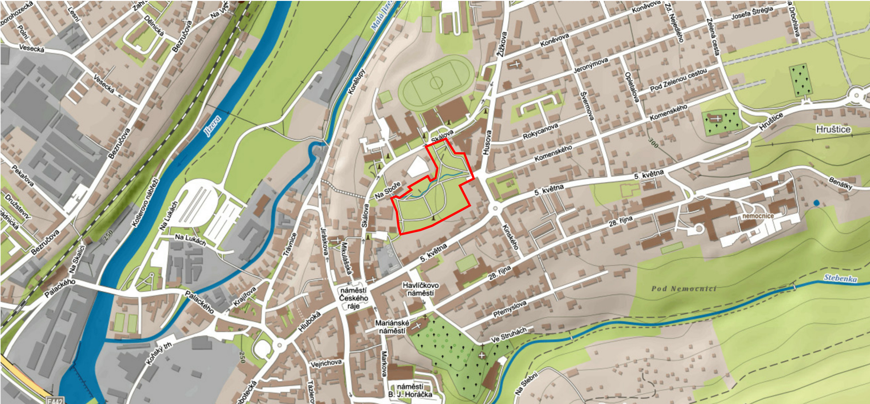
Mapa 1:5 000 Vyznačení městského parku